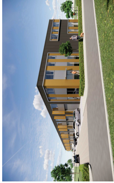
26 bedrijfsunits Harregat te Zuidland

Aan deze info kunnen geen rechten ontleend worden. Bij het samenstellen is alle mogelijke zorgvuldigheid in acht genomen. Deze tekening niet gebruiken voor uitvoering van enige werkzaamheden. Staalconstructie- en kolomberekeningen volgens opgaaf constructeur.