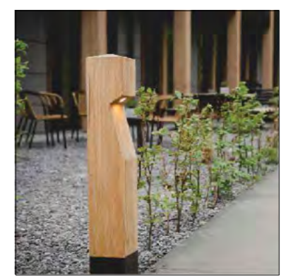
Bolderverlichting type EYE