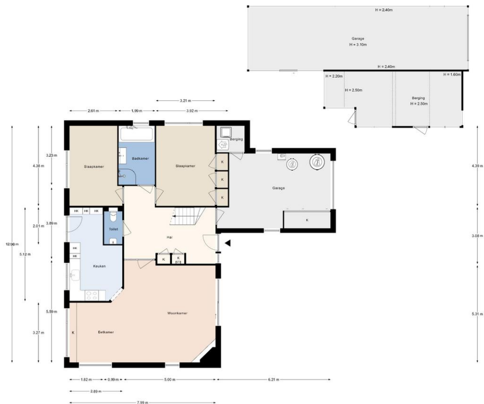
Groeneveld 1B, De Lier | Begane grond H = 2.56 m