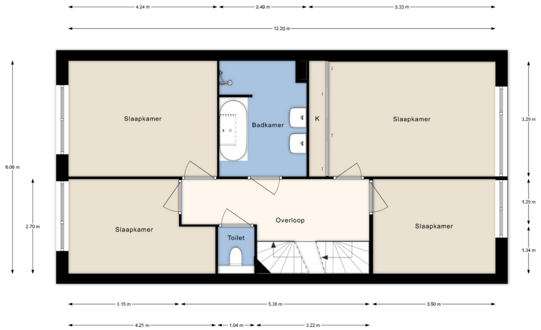
SAtlantische Oceaan 20, Naaldwijk | 1e verdieping H = 2.64 m