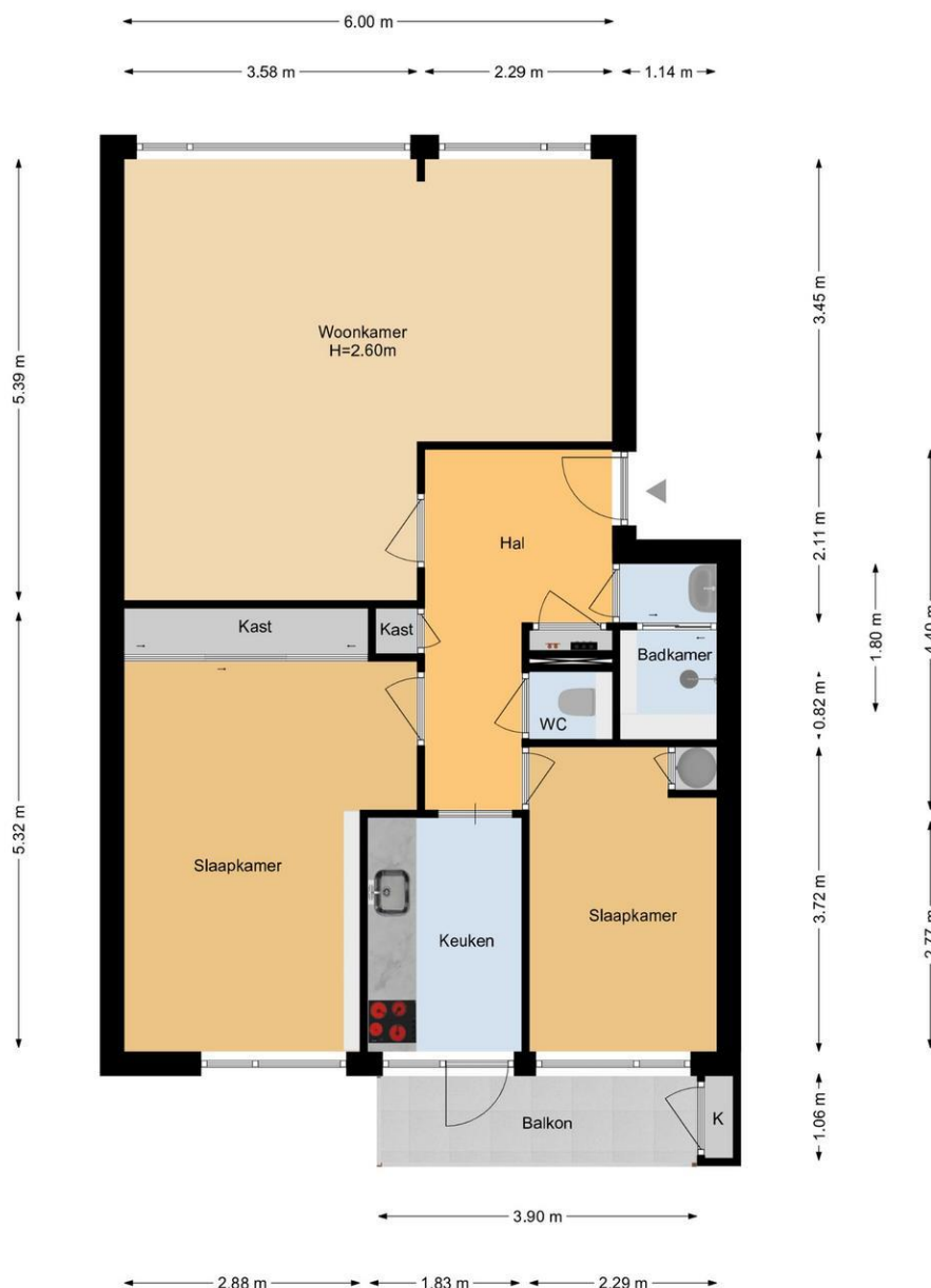
Koningin Julianaweg 122 | 's-Gravenzande 1e Etage

De plattegronden zijn geproduceerd voor promotionele doeleinden en ter indicatie. Aan de plattegronden kunnen geen rechten worden ontleend. www.woonkeur365.nl