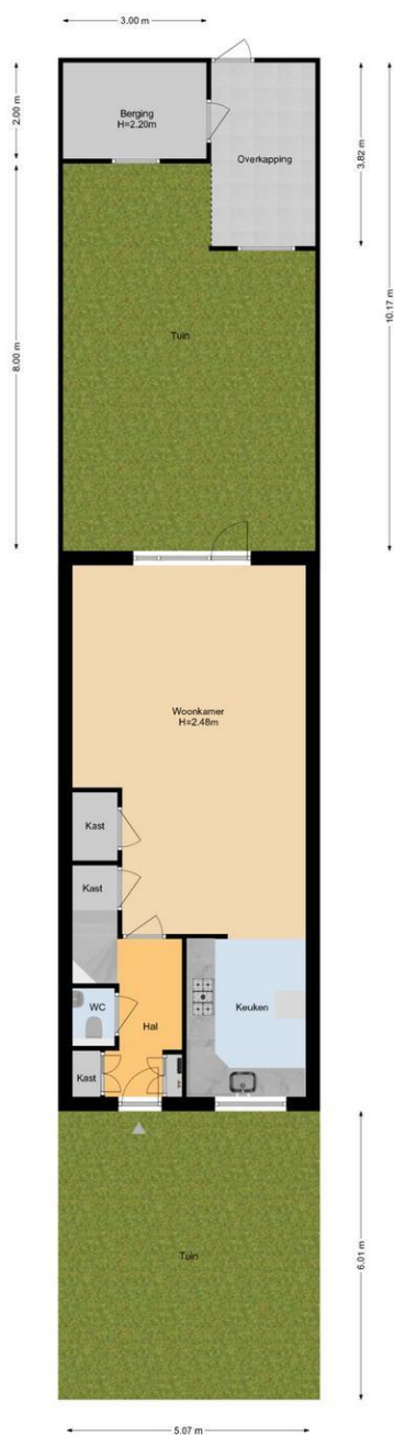
Ruys de Beerenbrouckstraat 3 | Naaldwijk Situatie

De plattegronden zijn geproduceerd voor promotionele doeleinden en ter indicatie. Aan de plattegronden kunnen geen rechten worden ontleend. www.wonen995.nl