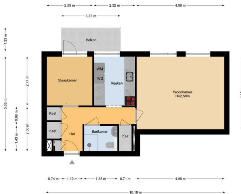
Pleinwand 11 | Wateringen 2e Etage

De plattegronden zijn geproduceerd voor promotieele doeleinden en ter indicatie. Aan de plattegronden kunnen geen rechten worden ontleend. www.woonkeur365.nl