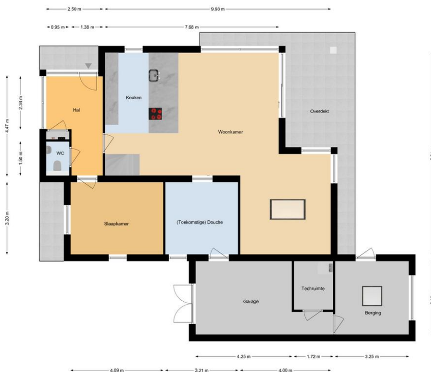
Vlietweg 2 | Naaldwijk Begane Grond

De plattegronden zijn geproduceerd voor promotionele doeleinden en ter indicatie. Aan de plattegronden kunnen geen rechten worden ontleend. www.woonkeur95.nl