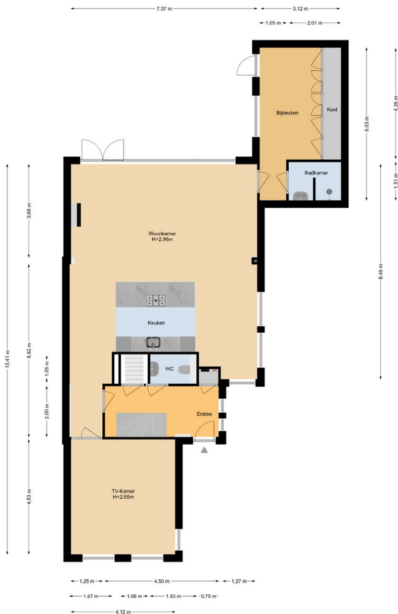
Geestweg 4 | Naaldwijk Begane Grond

De plattegronden zijn geproduceerd voor promotionele doeleinden en ter indicatie. Aan de plattegronden kunnen geen rechten worden ontleend. www.woonkeur365.nl