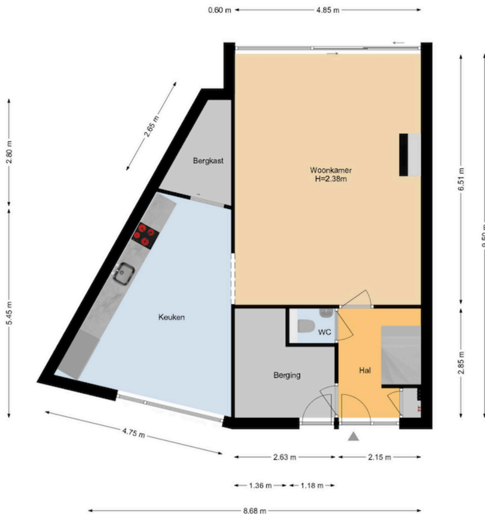
Waterlelie 5 | Naaldwijk Begane Grond

De plattegronden zijn geproduceerd voor promotionele doeleinden en ter indicatie. Aan de plattegronden kunnen geen rechten worden ontleend. www.woonkeur365.nl