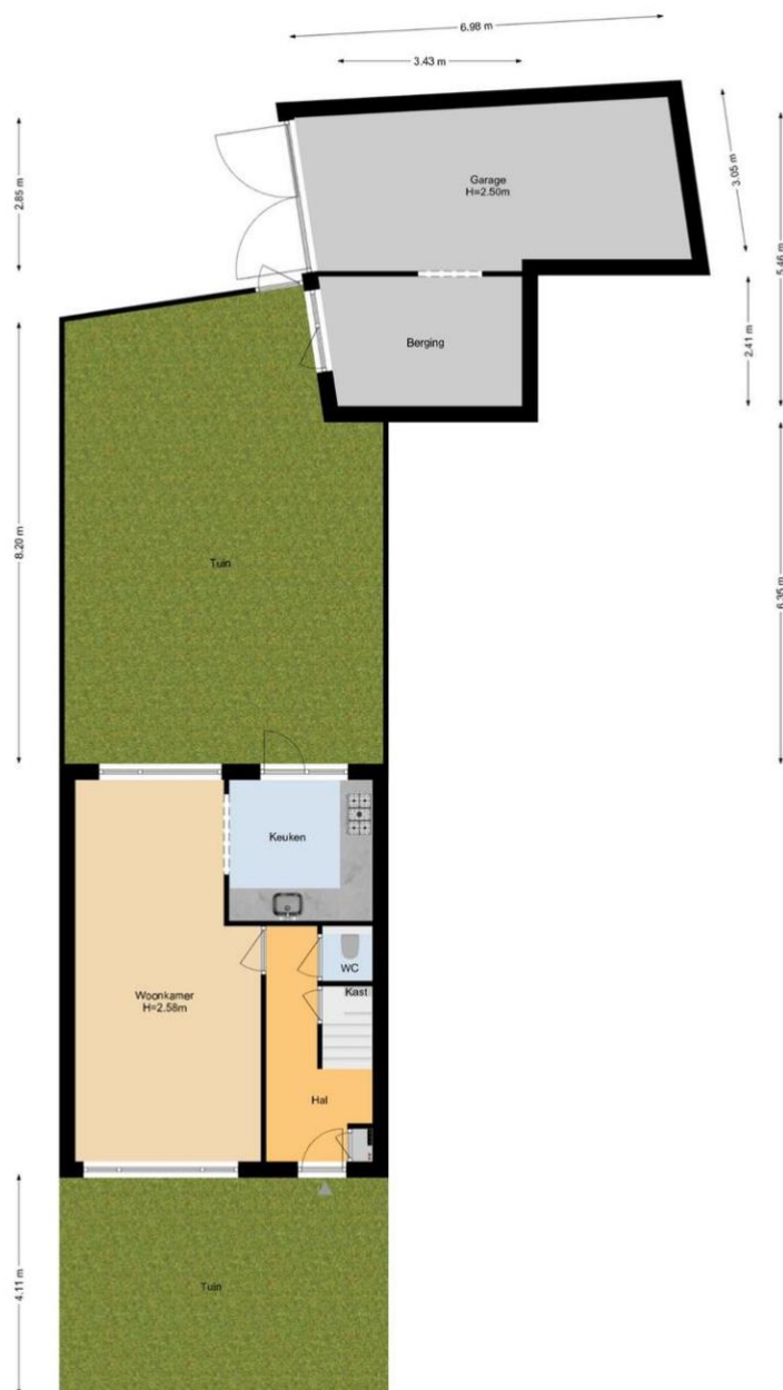
Karel Wiersmastraat 3 | Naaldwijk Situatie

De plattegronden zijn geproduceerd voor promotionele doeleinden en ter indicatie. Aan de plattegronden kunnen geen rechten worden ontleend. www.woonkeur365.nl