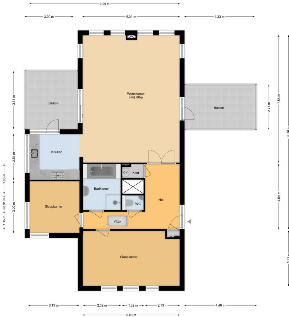
Voorstraat 8B | Poeldijk 2e Etage

De plattegronden zijn geproduceerd voor promotionele doeleinden en ter indicatie. Aan de plattegronden kunnen geen rechten worden ontleend. www.woonkeur365.nl