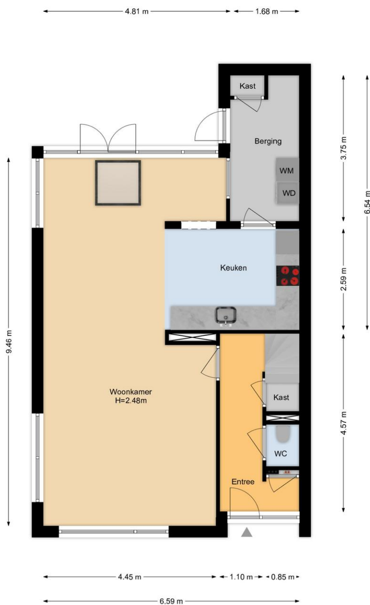
Het Tolland 67 Wateringen Begane Grond

De plattegronden zijn geproduceerd voor promotionele doeleinden en ter indicatie. Aan de plattegronden kunnen geen rechten worden ontleend. www.woonkeur365.nl