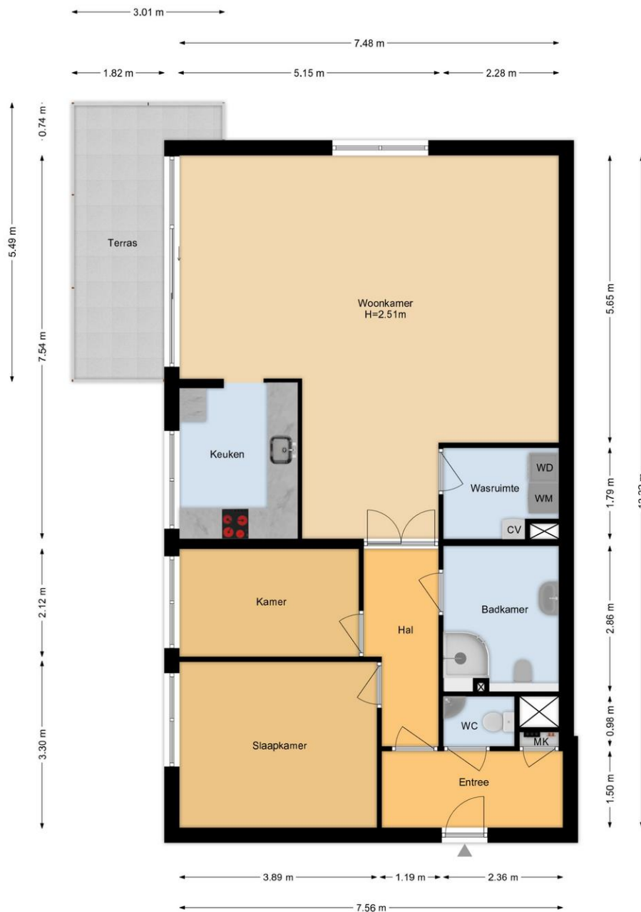
De Dommel 85 | Naaldwijk Begane Grond

De plattegronden zijn geproduceerd voor promotionele doeleinden en ter indicatie. Aan de plattegronden kunnen geen rechten worden ontleend. www.woonkeur365.nl