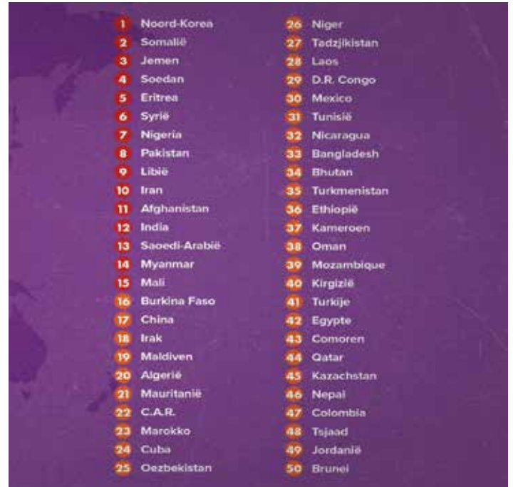
Ranglijst christenvervolging 2026.

Ook in de Sint-Catharijnekerk komen we enkele regelmatige kerkgangers tegen die uit eigen ervaring weten wat christenvervolging betekent. Vanwege hun christelijke activiteiten moest de een het land van herkomst ontvluchten en de ander kon er niet naar terug. Omdat hun leven in het land waar ze vandaan ko-