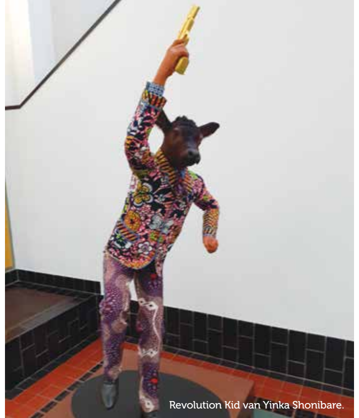
Revolution Kid van Yinka Shonibare.

'Ik sla mijn ogen op en zie de hoge bergen aan, waar komt mijn hulp vandaan? Mijn hulp is van mijn Here, die dit alles heeft geschapen. Mijn herder zal niet slapen.'