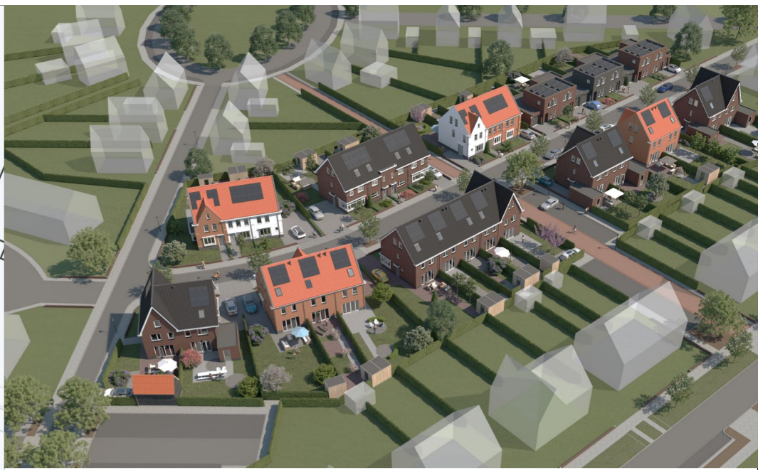
aan de artist impression en aan de kleuren van de gevelaanzichten en posities van zonnepanelen kunnen geen rechten worden ontleend