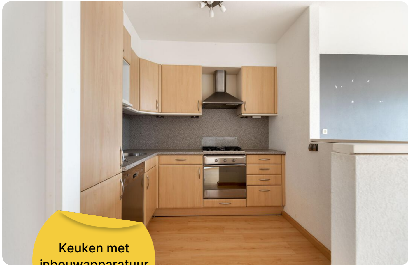
Keuken met inbouwapparatuur