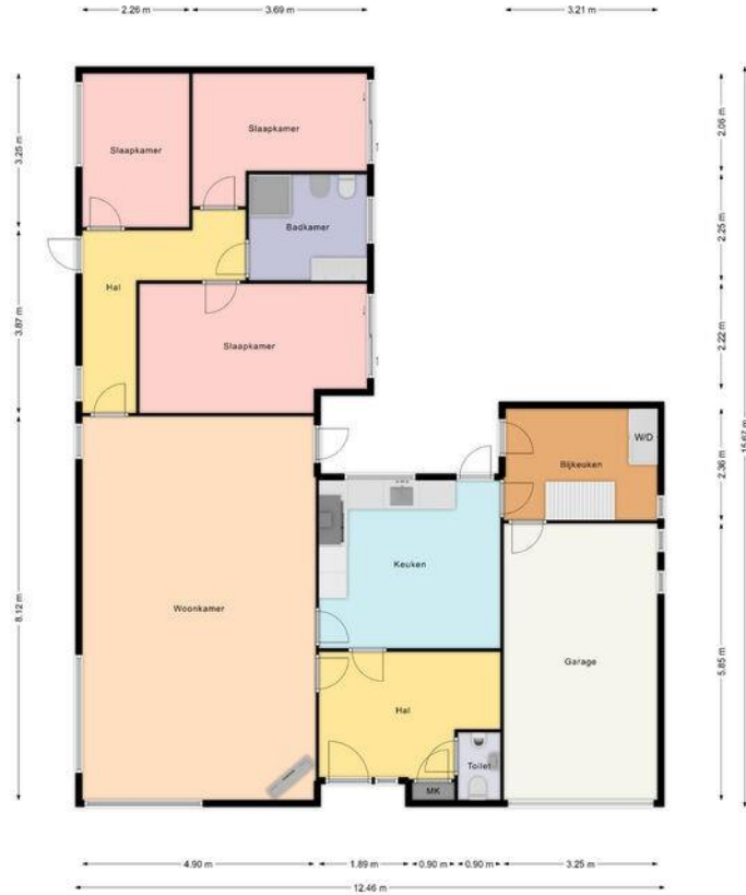
Plattegrond eerste verdieping