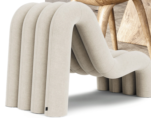
Fest Amsterdam Alp fauteuil