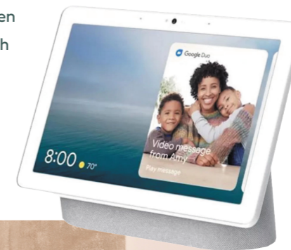
GOOGLE NEST Hub Max Chalk Slimme speaker Beige

In een veranderende woonwereld (meer thuiswerken, kleinere woonruimtes) krijgt meubelontwerp en technologie een subtielere rol: meubels passen zich aan, techniek integreert zich onopvallend, ruimtes vervagen.