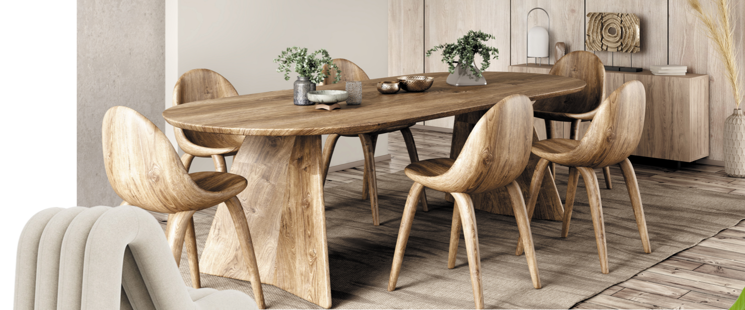
Fest Amsterdam Alp fauteuil

In 2026 draait wonen om warmte, karakter en bewust leven. Duurzame materialen, organische vormen en natuurlijke tinten brengen rust en harmonie in huis. Handgemaakte meubels, retro-accenten en slimme technologie zorgen voor een interieur dat niet alleen mooi is, maar ook echt bij je past.